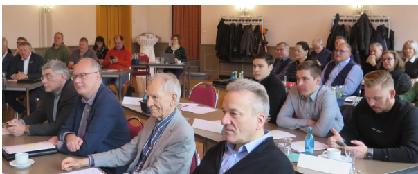
Bild: Teilnehmer der Mitgliederversammlung am 28.11.2024 in Döbeln

Abschließend trug der Geschäftsführer den Lagebericht des Fachverbandes im abgelaufenen Geschäftsjahr und die Finanzen des Fachverbandes SHK Sachsen vor. Nach Beratung und Diskussion wurden der Bericht des Vorstandes und der Jahresabschluss des Fachverbandes für 2024 bestätigt und Vorstand und Geschäftsführung entlastet. Weiterhin wurde der Beitritt des Fachverbandes SHK Sachsen zum Sächsischen Handwerkstag beschlossen.